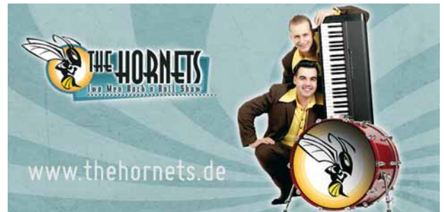
Beim Sportlerball: The Hornets – Two Men Rock 'n' Roll Show

Der Bustransfer von den Hotels zum Sportlerball erfolgt ab 18.30 Uhr mit den Bussen der Sportfestteilnehmer sowie mit zusätzlich eingesetzten Shuttle-Bussen. Alle Busse mit der Bezeichnung „Sportlerball“ können von allen Sportlern genutzt werden. Für die Rückfahrt vom Sportlerball zu den Hotels stehen Shuttle-Busse ab 23.00 Uhr zur Verfügung.